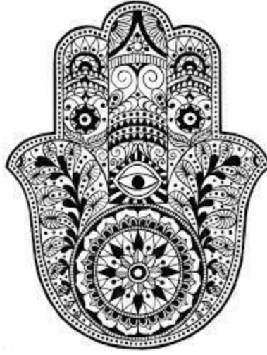
شكل رقم (2)